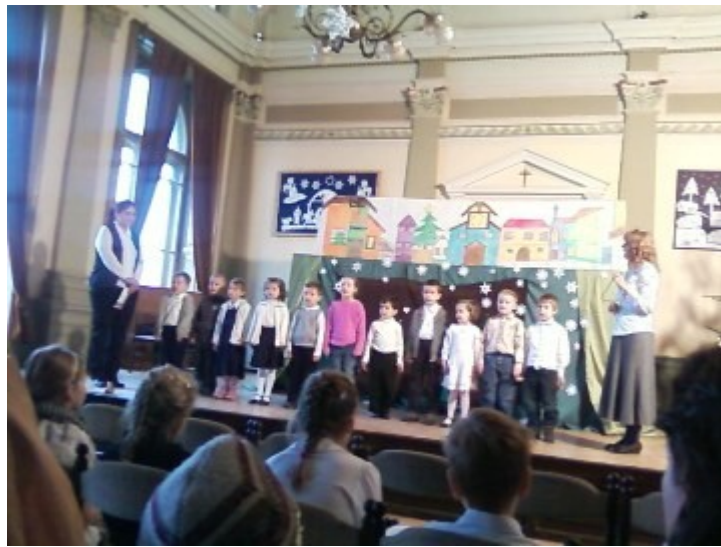
Az óvodások műsora

19. 2011. december 20-án a Gyermek Karácsonya ünnepségen vettünk részt a nyíregyházi evangélikus általános iskolában. Megható volt az óvodások és általános iskolás gyermekek Karácsony várása!