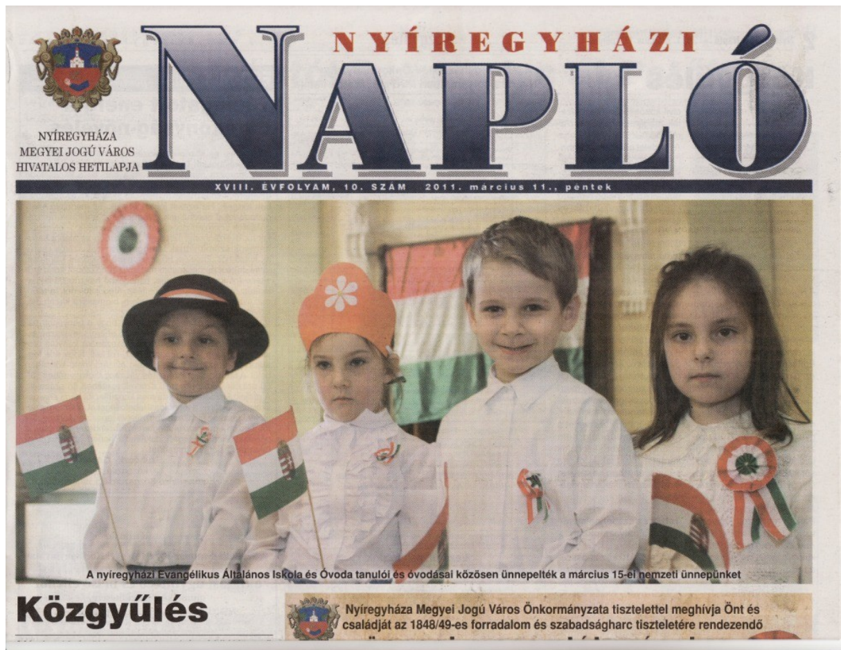
Az óvodások műsora a Nyíregyházi Naplóban is megjelent