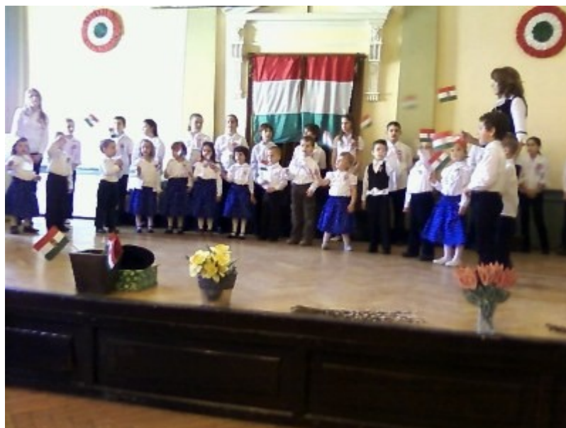
A legőszintébb öröm mindig a gyermekeké