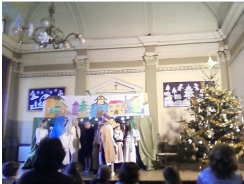
az általános iskolások műsora