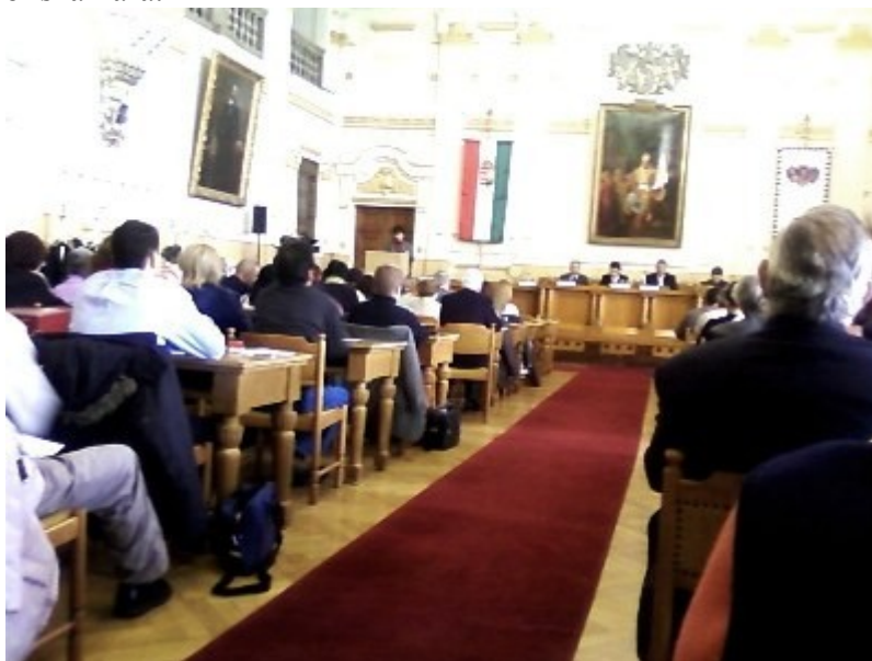
A fórum résztvevői