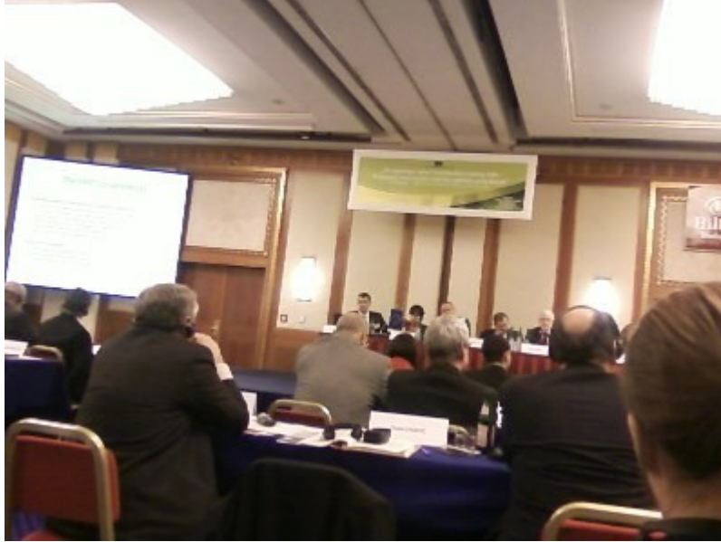
Budapest, Hilton Hotel, EGSZEB

3. 2011. február 21-én EGSZEB konferencián vettünk részt Budapesten.