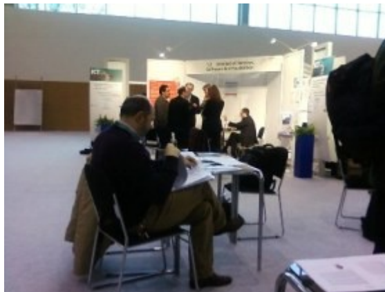
A résztvevők egy csoportja, április 16.

7. ICT konferencia Budapesten, a magyar EU elnökség égisze alatt, a vásárvárosban.