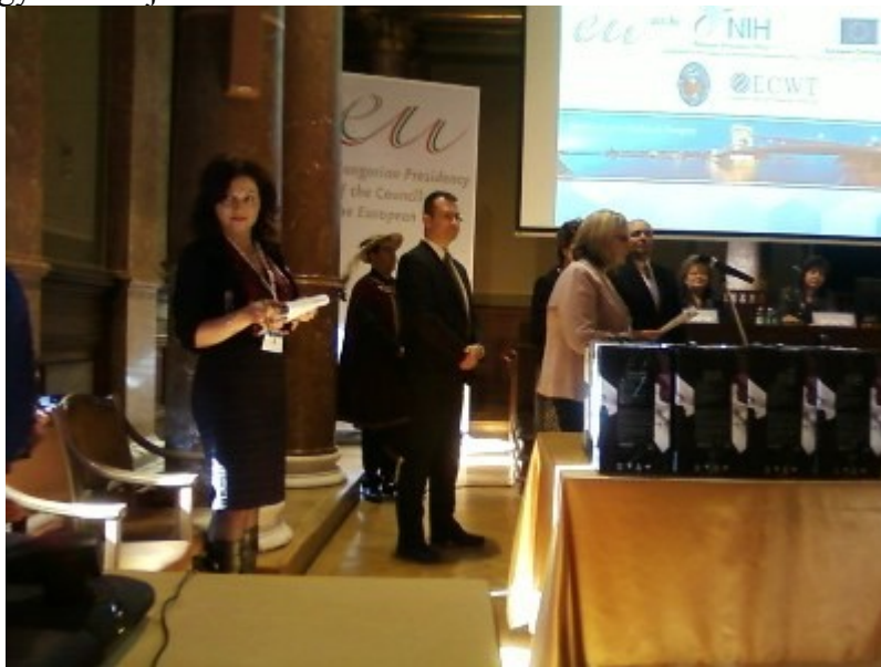
A díjátadás pillanata

4. 2011. március 6-8. között Budapesten "Nők a tudományban, innovációban és technológiában a digitális korban, 2011-ben" konferencián vettünk részt Budapesten, a Magyar Tudományos Akadémián. A fiatalok pályadíjait is itt osztották ki, a különböző nemzet gyermekrajz alkotóinak.