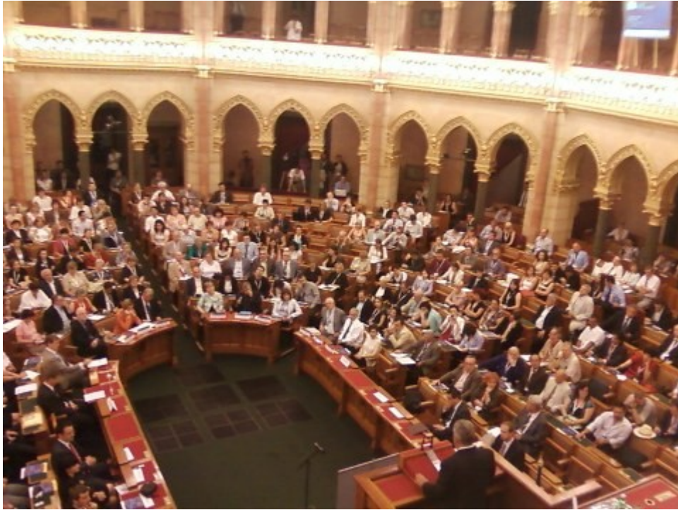
A résztvevők egy csoportja

9. 2011. július 19-én 14 órától a Keresztényekért Alapítvány kuratóriumi ülést tartott. Napirendi pontok: a 2011. évi eddigi alapítványi tevékenység, a munkaterv, gazdasági terv, valamint a 2010. évi közhasznúsági jelentés elfogadása. A kuratórium a kérelmeket is elbírálta.